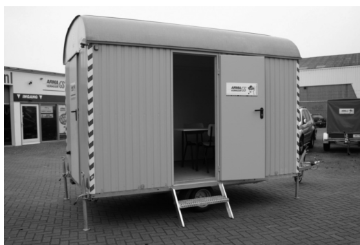
Een bouwkeet voor de werknemers die daar hun broodje eten.