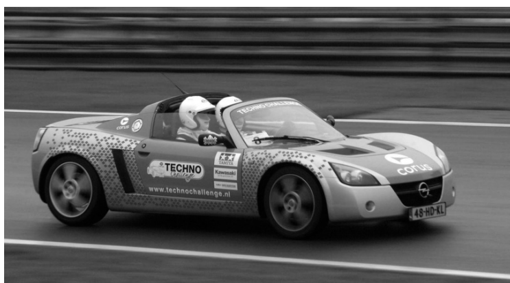
Zoals de Techno Challenge auto!