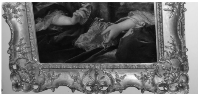
Versierde en opengewerkte schilderijlijst