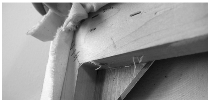
Raamwerk achter het doek