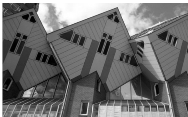
Kubuswoningen in Rotterdam.