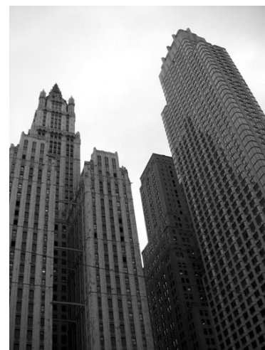
Wolkenkrabbers hebben een sterk stalen skelet