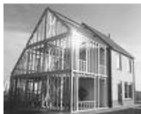
Staalframebouw voor een woning