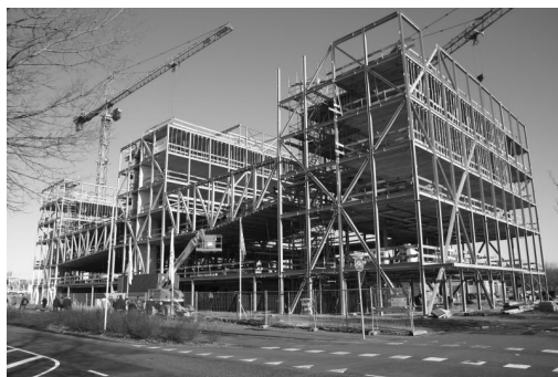
Staalskelet voor een kantoorpand of fabriek