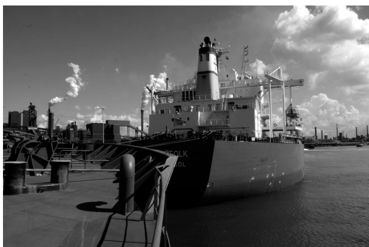
Met grote boten worden de grondstoffen om staal te maken naar Tata Steel gebracht.