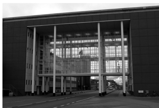
In de constructie van het Dudokhuis bij Tata Steel zijn ook palen gebruikt.