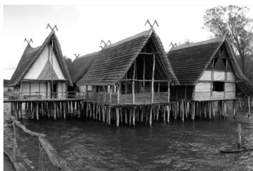
Een paalwoning van bamboe.